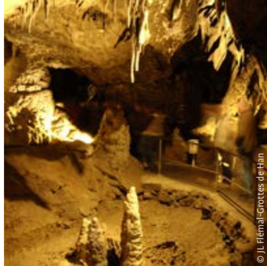
© J.L. Flémal - Grottes de Han