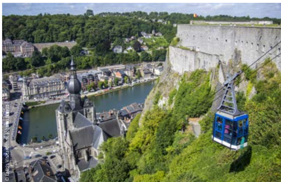
© Laëtis Visikardenne - Johan Van Barrot