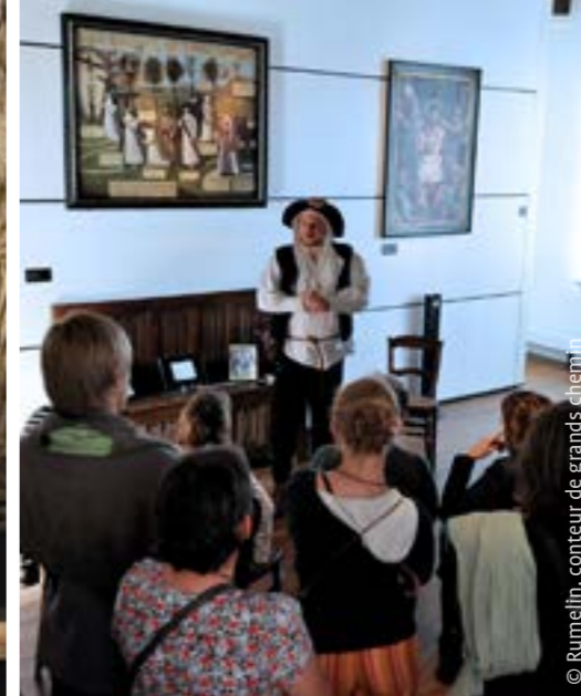
© Rumelin, conteur de grands chemins