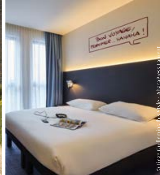
© Liège Guillemins Ibis Style - AbacaPress Laurent